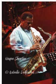
Wayne Shorter

Jazz-Rock des 70's, où les sons chauds de l'Orgue Hammond et du Sax Ténor sont cuisinés avec des rythmiques funky Guitare-Batterie : un groove à l'état pur.