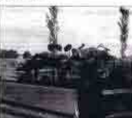
Le festival de jazz "Blue Buëch" sera organisé par l'association "Blue Buëch" et sera animé par le directeur de la commune, Jean-Benoît Lasserre. Le festival sera ouvert à tous les publics et sera gratuit.