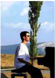
Tigran Hamasyan à Serres

Révélation du festival de jazz de Yerevan en 2000, premier prix de la catégorie jazz instrumental du concours de Juan-les-Pins en avril 2003, ce jeune pianiste de 17 ans est en train de conquérir le monde du jazz. L'écoute de son premier album "Introducing Tigran Hamasyan" révèle un pianiste en pleine maturité avec un langage original intégrant l'héritage de ses prédécesseurs (Bill Evans, Keith Jarrett) et les accents de son pays.