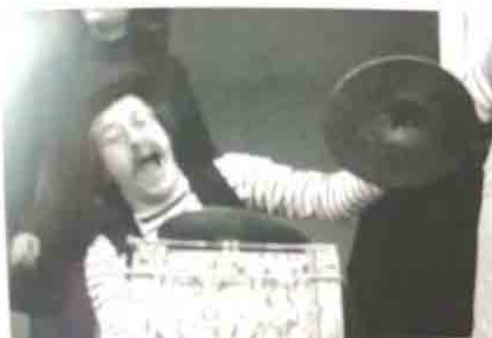
Fanfare des beaux-Arts, "Othello", 1973 ...les débuts d'une belle carrière.