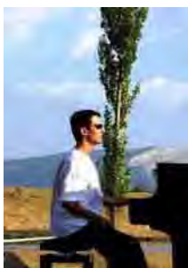
Tigran Hamasyan in Serres