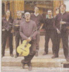
Deux temps forts en perspective avec l'ensemble « Nuages de swing » et l'association troupe de « Sergent pépère ».

Trois soirées sont au programme du deuxième festival de jazz à Serres. Le prodige arménien Tigran Hamasyan, Nuages de swing et la tolle troupe de Sergent pépère ont à découvrir de jeudi à samedi à la base de loisirs.